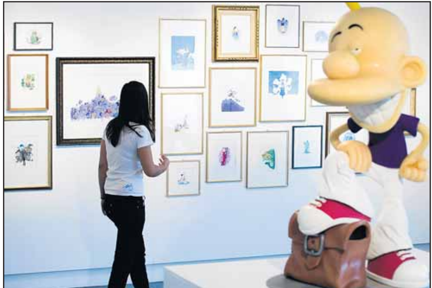
Parmi les musées qui vont attirer les foules, le mudac et son expo consacrée à Zep.

En plus de trois films muets d'Ernst Lubitsch accompagnés par un pianiste et un bonimenteur qui traduira les intertitres, la Cinémathèque propose une séance en audiodescription: «Déchaînées», de Raymond Vouillamoz, sera projeté avec un procédé visant à décrire le contenu des plans pour les malvoyants. Auparavant, une démonstration de trente minutes per-