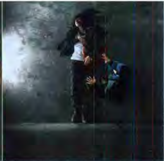
ANNAÏK LOU PITTELOUD «Hover», 2007, montage numérique, Impression lambda sur papier photo montée sous plexiglas.