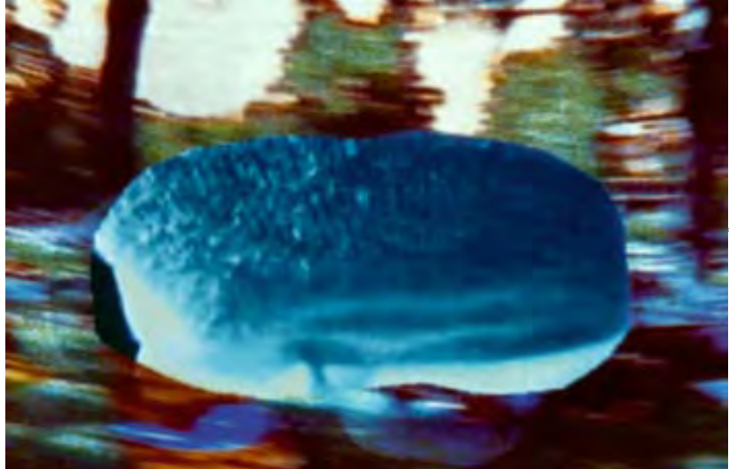
COURTESY OF THE ARTIST AND HAUSER & WIRTH ZÜRICH COLLECTION D'ART DE LA BANQUE CANTONALE DE ZÜRICH

Soucieuse de soutenir le tissu économique et culturel local, la banque zurichoise s'intéresse depuis 2001 plus particulièrement à la jeune génération et acquiert des pièces créées après 1990. Une trentaine d'entre elles seront présentées à Lausanne, des pièces signées Pipilotti Rist, Urs Lüthi, Mario Sala, Olaf Breu-