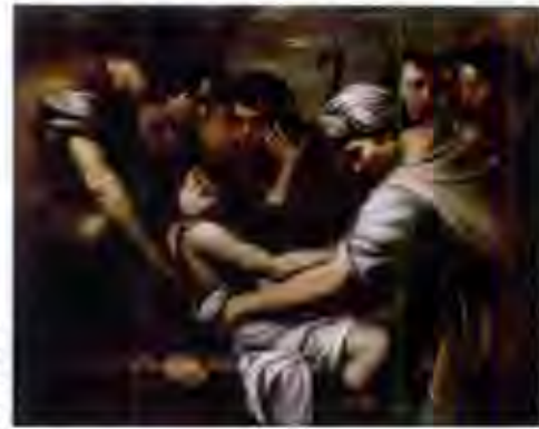
Andrea Vaccaro, Les Fils de Jacob précipitant leur frère Joseph dans la citerne, vers 1640. Lausanne, Musée cantonal des Beaux-Arts.